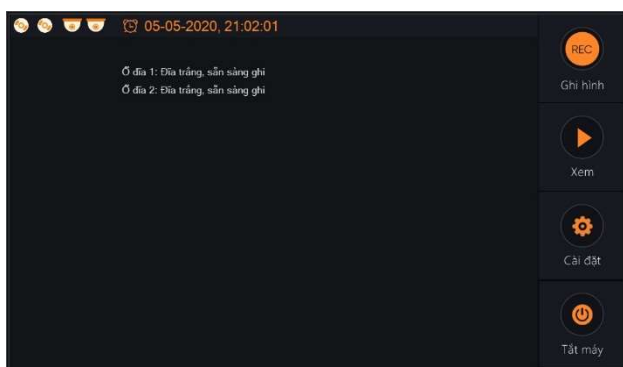
Giao diện chế độ ghi âm hoặc ghi hình có âm thanh