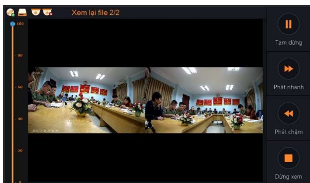
Chế độ xem lại phiên hỏi cung