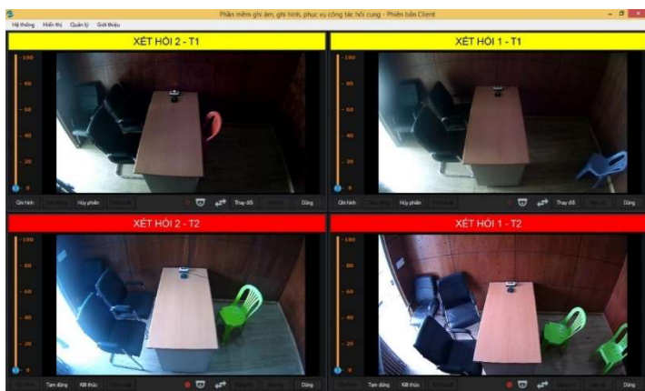
Xem trực tuyến các phòng xét hỏi