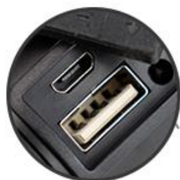
Cổng sạc type C đa dụng Cổng USB output 5VDC/2A