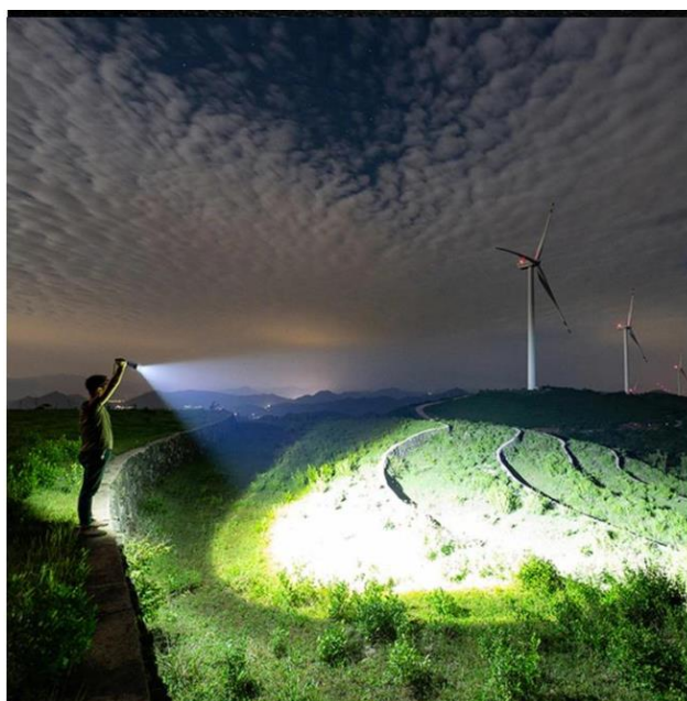
Cường độ sáng 1200 LM, 200-500m