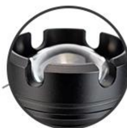
Chóa đèn có thể dùng tự vệ