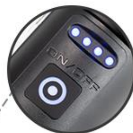
Công tắc thông minh 2 chế độ Led hiển thị dung lượng Pin